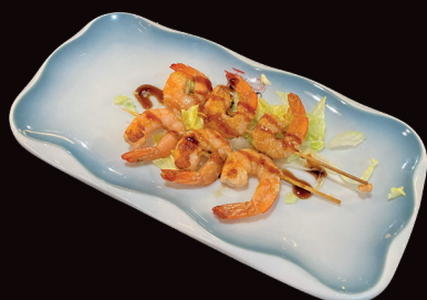
098 Spiedini di gamberi* € 6,00