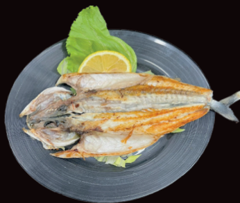
091 Teppan suzuki branzino grigliato € 10,00