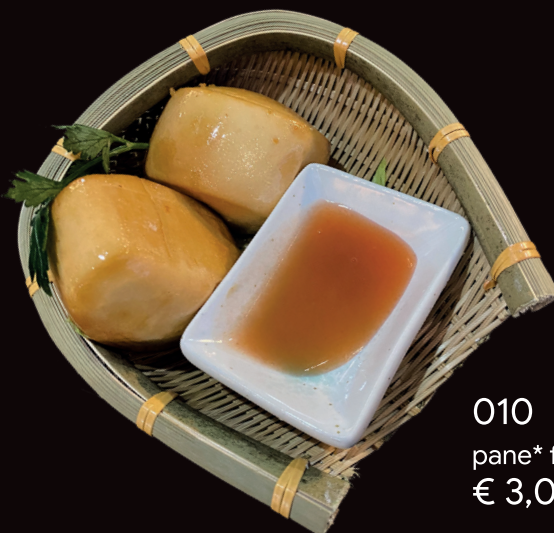
010 Mantou fritto pane* fritto € 3,00