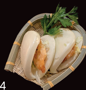
014 Mo salmone pane al vapore con salmone, maionese, insalata € 4,00