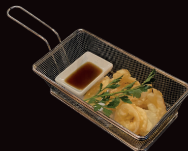
017 Ika Furai anelli di calamari* fritti € 6,00

024 Tempura mista ..... € 8,00 frittura mista