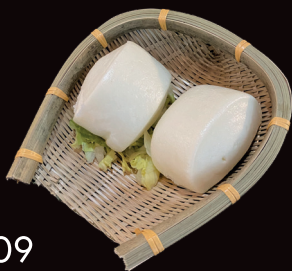
009 Mantou pane* al vapore € 3,00