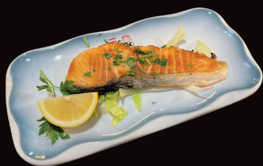
090 Teppan salmone filetto di salmone grigliato € 8,00