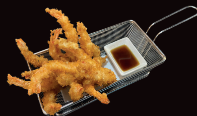
016 Ebi Pan gamberi* ricoperti di pangrattato € 6,00

015 Ebi nido ..... € 6,00 gamberi* avvolti in pastella kataifi