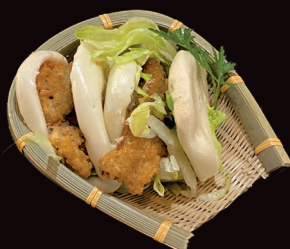
013 Mo manzo pane al vapore con manzo fritto, maionese, insalata € 4,00