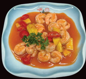
085 Gamberi agrodolce gamberi*, pomodoro, ananas € 6,00