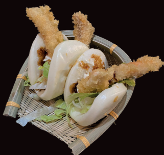
012 Mo pollo pane al vapore con pollo fritto, maionese, insalata € 4,00