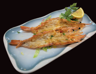
092 Ebi Teppan gamberoni* grigliati € 8,00